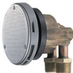
参考商品 1：循環接続金具 カクダイ 一口循環接続金具 4142

人工大理石製バスタブへ追焚アダプターを取付ける場合、バスタブの厚みがあるため、通常の追焚アダプターの取付ができません。当社が推奨しております延長部材をご準備していただくことで、ご対応をお願い致します。 ※当社では、延長部材を提供しておりません。取付業者様の方でご準備ください。