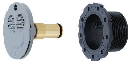
参考商品 2：循環金具貫通幅延長アダプター カクダイ 一口循環接続金具取付アダプター 414-303-30